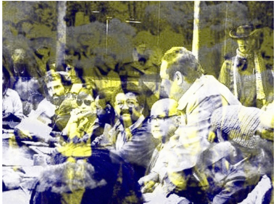
Figura 8. Apropiación de archivo fotográfico de los primeros acuerdos de paz en Colombia, con las FARC-EP