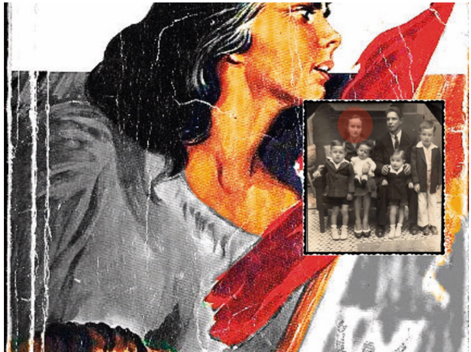
Figura 1. Fotografía del libro La Madre de Máximo Gorki

■ Este capítulo es sobre la niñez de mi madre, la muerte de su madre. Su padre y la fuerza de su ideología política; el amor por su hermano mayor, referente de sus inicios en el partido comunista colombiano.