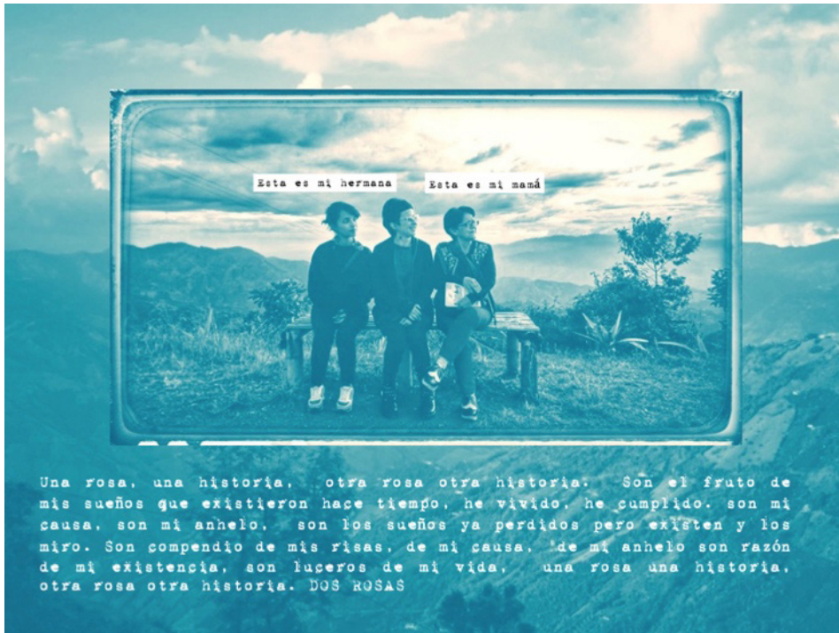
Foto 6. Fotografía de mi hermana y mi madre, textos de mi madre