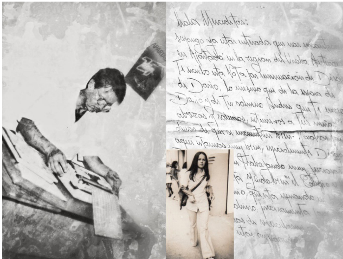
Figura 3. Sindicato de Carniceros de La Plaza de Mercado de Apartado -Antioquia. Nota: Fotografía del hermano de mi madre, de allí tuvo que salir, por amenazas de grupos paramilitares. Al lado una carta escrita a Mercedes