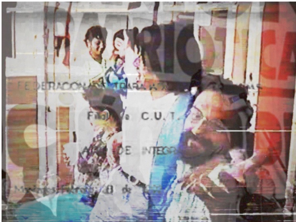
Figura 7. Fotograma de archivo de vídeo de las fiestas de sindicato, en la Central Unitaria de Trabajadores de Caldas (FEDECALDAS)