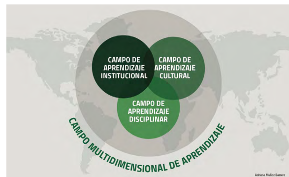
Figura 2. Campo multidimensional de aprendizaje.

naturaleza, institución y sociedad), que operan conjuntamente con el fin de lograr la formación de una persona para la vida, los valores democráticos, la civilidad y la libertad.