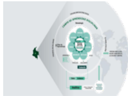
Figura 3. Campo de aprendizaje institucional

El campo de aprendizaje cultural (figura 4) busca cultivar, fortalecer y crear experiencias, usos, signos, costumbres, principios y valores, que distinguen espiritualmente a una comunidad universitaria formadora de una persona transhumana. En la Universidad de Cundinamarca, todos los espacios donde actúan los estudiantes son significativos