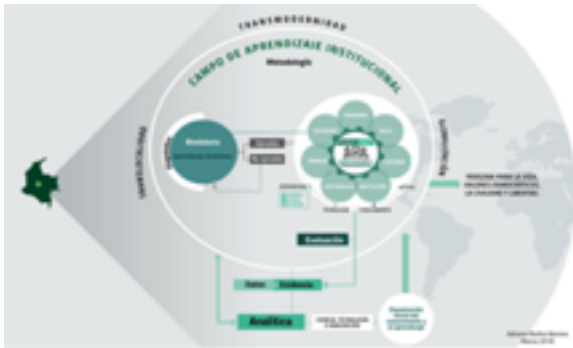
Figura 3. Campo de aprendizaje institucional

a través de un aprendizaje autónomo y colaborativo, soportado en la tecnología.