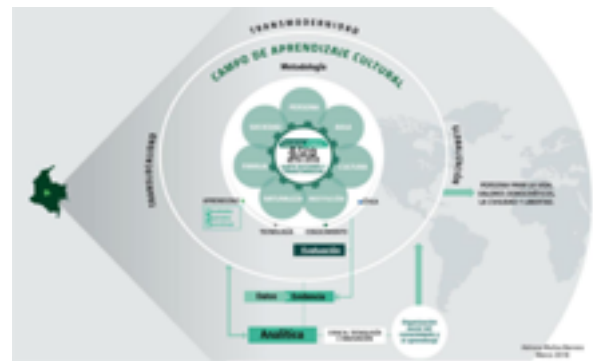
Figura 4. Campo de aprendizaje cultural

para el aprendizaje, por lo tanto, deben ser intervenidos por la institución para que, de esta manera, se refleje en actos o comportamientos que mejoren la vida, fortalezcan los valores democráticos, la civilidad y la libertad.