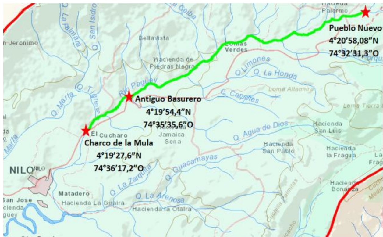
Figura 1. Tramos analizados del Rio Pagüey (Nilo-Cundinamarca)

La colecta diurna se realizó el 23 de abril de 2013 con el módulo de profundización I: Recursos Hidrobiológicos del programa de ingeniería Ambiental, Universidad de Cundinamarca Seccional Girardot, en tres tramos diferentes del Rio Pagüey (Figura 1). En cada tramo durante 1 horas se colectó al azar una muestra en conjunto de macroinvertebrados acuáticos, constituida por seis submuestras de los microhábitat de rápidos, remansos y orilla, empleando una red Surber (0.9 m 2 ), además de una inspección manual y redes de patada para incrementar el esfuerzo de muestreo. Los individuos colectados fueron preservados en alcohol (70%) y depositados en frascos plásticos debidamente rotulados. El material colectado fue revisado con las claves y anotaciones de Fernández y Rodríguez [5] y Roldan [6]. El material biológico se encuentra actualmente depositado en la Colección de Docencia del Programa de Ingeniería Ambiental de la Universidad de Cundinamarca seccional Girardot.