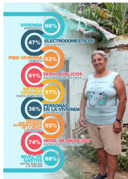
Figura 1. Perfil de la mujer arbelaence

Nota: Mujer rural arbelaence [fotografía] por María Paula Guerrero Abril (2022). Fuente: elaboración propia.